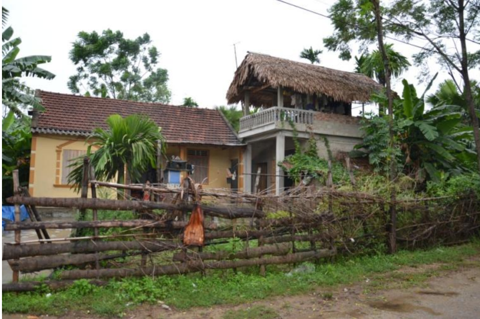
Traditional shelter for cattle - Ha Tinh Province

This efficient local practice has been successfully integrated in the national safe housing programmes in Central Vietnam, with hundreds of new safe shelters for cattle.