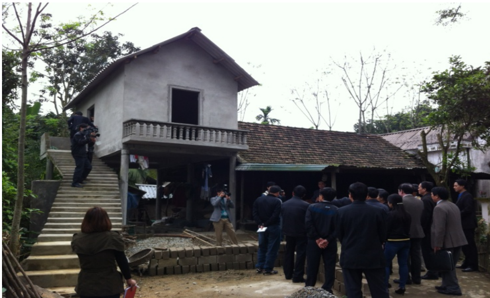
Programme 716 Ministry of Construction - Ha Tinh Province